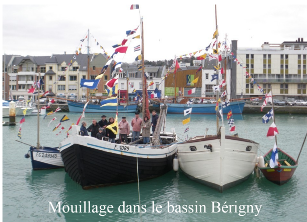
Mouillage dans le bassin Bérigny

Les « Saint Pierre » se suivent et se ressemblent, à l'exception de ce 6 février 2011 où le froid n'est pas au rendez-vous. Ce temps clément permet à bon nombre de Fécampoïses d'être présents en ce jour du souvenir de nos anciens Terre Neuvas et autres marins qui ont fait la prospérité de la pêche Fécampoïse.