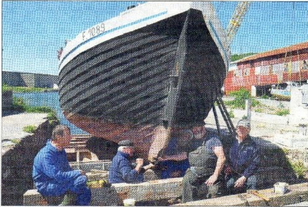
La caïque se refait une santé avant la mise à l'eau